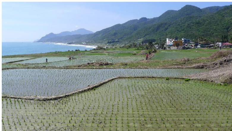
➤ 新社海階水梯田農業文化景觀

傳統上，相關主管機關容易本於各自的主管業務，傾向以單一社區或部落為服務對象，造成各個主管機關各自就部門的主管面向協助不同的部落。然而在地社區和部落的整體生產、生活和生態問題，必須在空間尺度和公私部門合作上採取跨域的協同治理模式，方能有效解決。2016 年 10 月，花蓮區農業改良場與東華大學合作，共同邀請花蓮林管處及水保局花蓮分局，與在地兩部落組成跨域（跨部門、跨社區）協同經營平台，發起花蓮縣豐濱鄉新社村「森-川-里-海」生態農業倡議，持續至今。